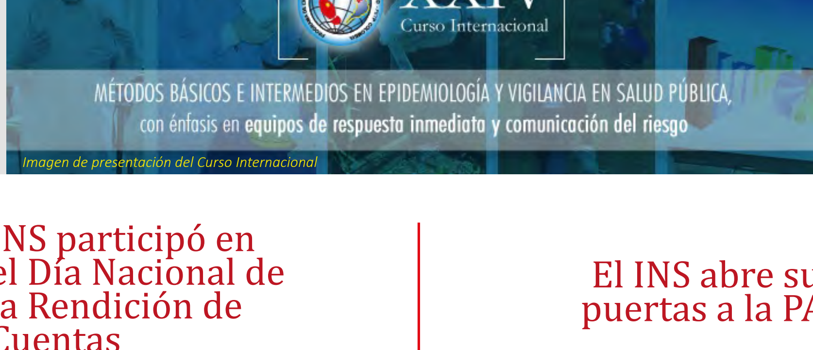
Imagen de presentación del Curso Internacional

Del 19 al 30 de septiembre se desarrollará en la ciudad de Bogotá la versión número 24 del Curso Internacional de Métodos en Epidemiología y Vigilancia en Salud Pública , que para el 2016 hace énfasis en equipos de respuesta inmediata y comunicación del riesgo. Al mismo tiempo los asistentes conocerán conocimientos generales en vigilancia en salud pública; estadística; investigación de campo; fundamentos para la creación y análisis estadístico de bases de datos. Serán dos semanas con expertos del INS, Ministerio de Salud y Protección Social, OPS, CDC, academia y consultores internacionales en temas como conformación de equipos de respuesta en salud; modelos de gestión del riesgo en salud pública; comités operativos de emergencia; percepción del riesgo; estrategias de comunicación del riesgo, entre otros.