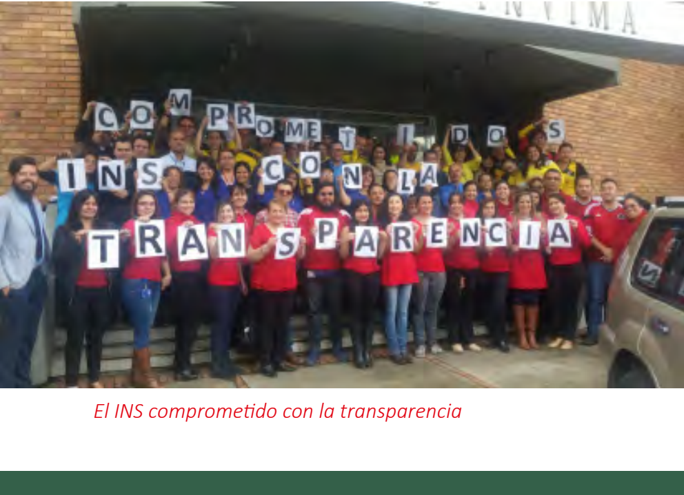
El INS comprometido con la transparencia

El 31 de agosto en las instalaciones de la Pontificia Universidad Javeriana de Bogotá, se realizó el Día Nacional de Rendición de Cuentas, en donde el presidente de la República Juan Manuel Santos premió a la mejor Audiencia Pública de la Vigencia 2015, entre todas las entidades del Estado. En la actividad el INS participó presentando la campaña y estrategia que utilizó para la Audiencia Pública 2015, y aunque no ganó, sí se resaltó la capacidad del Instituto para hacer sinergia con la Red de Emisoras de la Armada Nacional, Uniminuto Radio y UN Radio WEB.