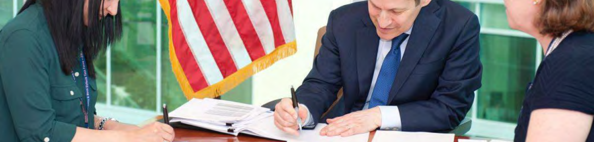
La Directora del INS y el Director del CDC, durante la firma del MOU